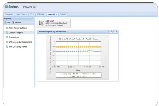
Power IQ-Bericht zu CO 2 -Emissionen

angeschlossen, die wiederum mit einer Stromquelle verbunden ist. Jede PDU verfügt auch über einen LED-Leistungsmesser sowie serielle Ports und Ethernet-Ports. Mit ein bis zwei Klicks auf einem Web-Dashboard kann das IT-Personal von AOL Energieinformationen zu jedem Gerät anzeigen. Außerdem können jederzeit und standort-unabhängig per Sensor gemessene Temperatur- und Feuchtigkeitswerte abgerufen werden. Gesammelte Strominformationen beinhalten Angaben zu Spannung, Stromstärke, Phasenwinkel, Schein- und Wirkleistung sowie zum Energieverbrauch in Kilowattstunden (kWh).