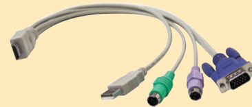
KVMケーブル ターゲットのVGA、PS/2、USB に挿入